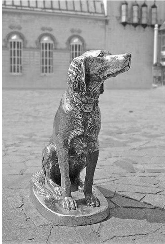
Памятник Белому Биму Чёрное ухо в Воронеже

Но почему же мама плакала? Окончание на 6-й стр.