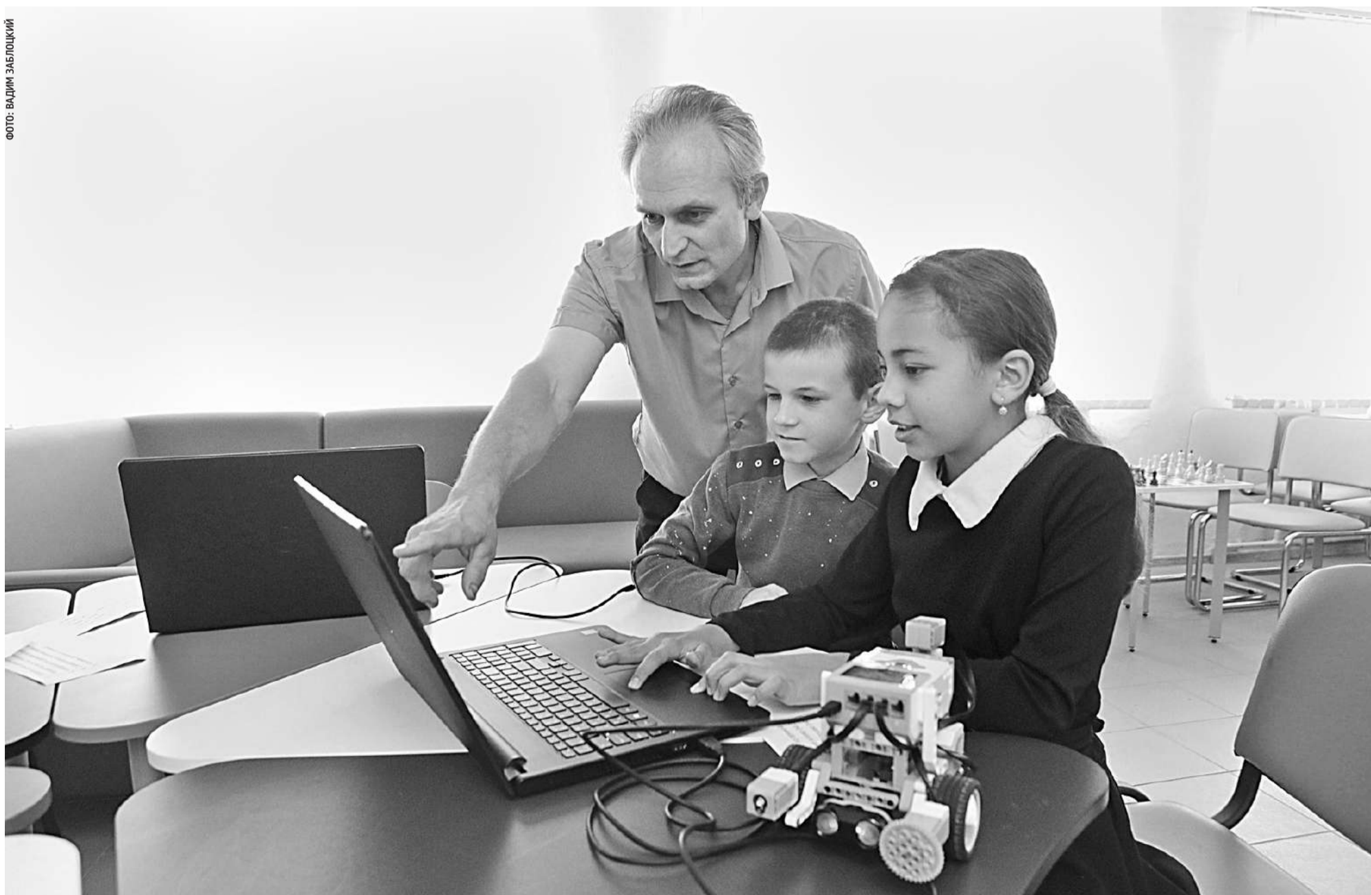
В Новенской школе Ивнянского района ребят учат моделировать роботов на компьютере в начальной школе