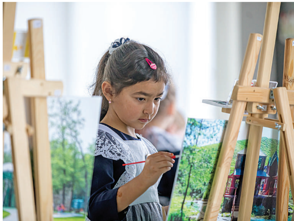
Занятие в зоне искусства