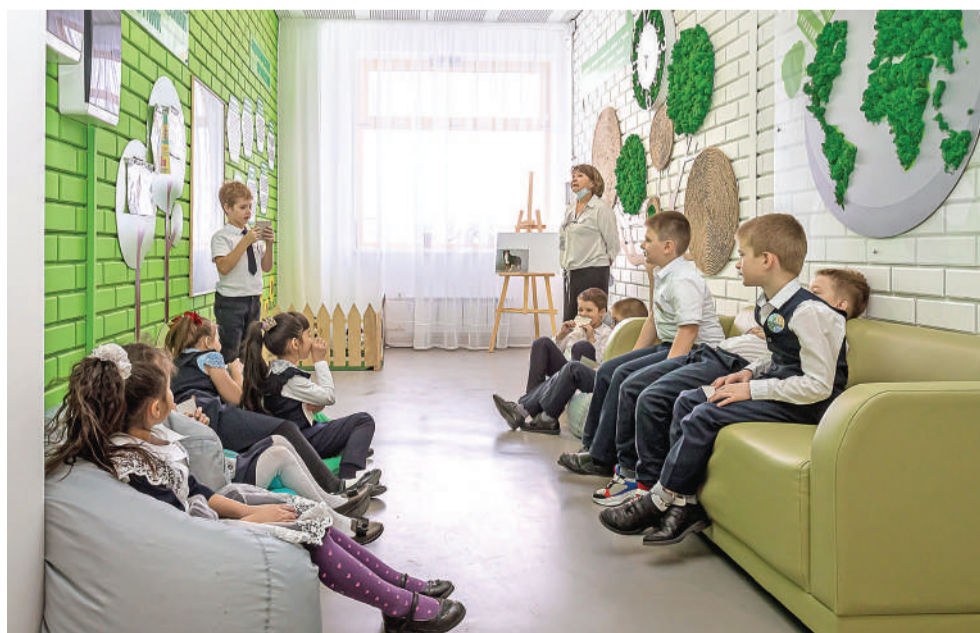
Внеурочное занятие для первоклашек в экологической зоне