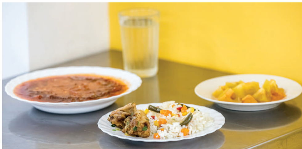
Контрольное блюдо в столовой