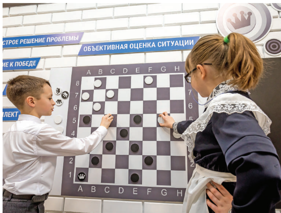
Дети на перемене играют в шахматы