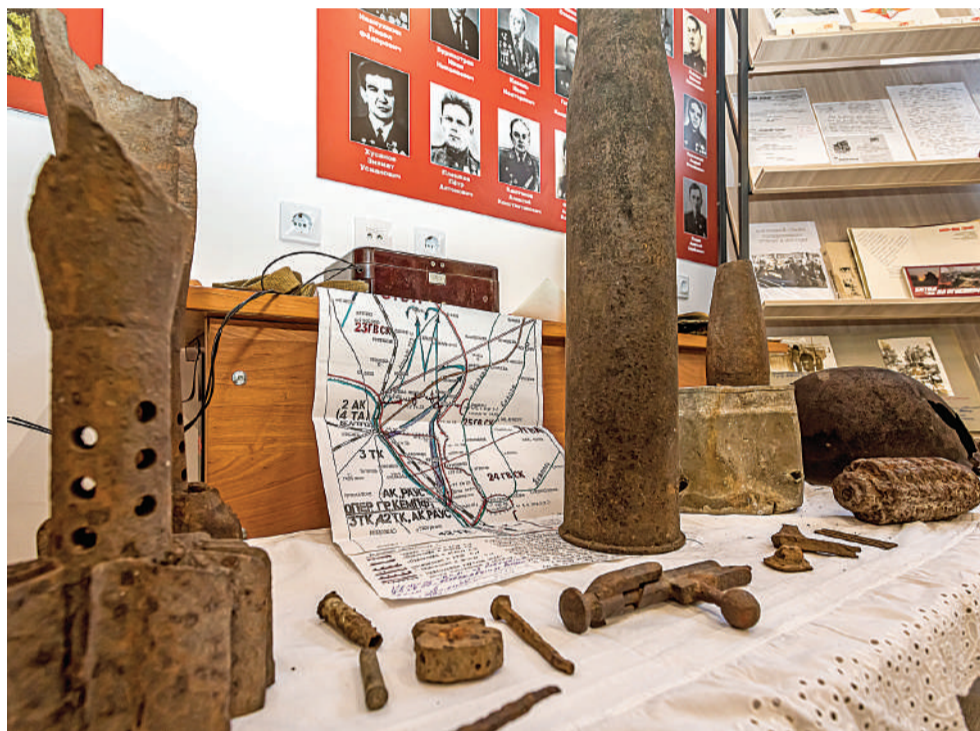
Школьный музей готовят к открытию