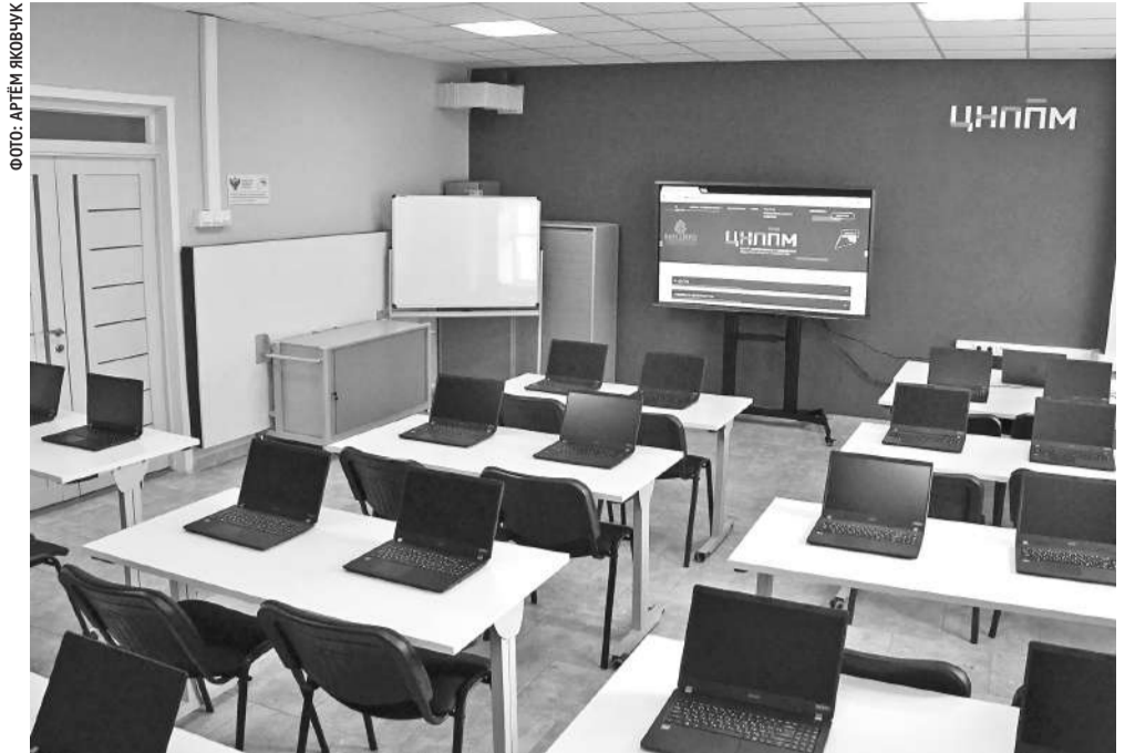
Один из компьютерных классов БелиРО

предоставляющее услуги в сфере цифрового контента для учащихся и педагогов.