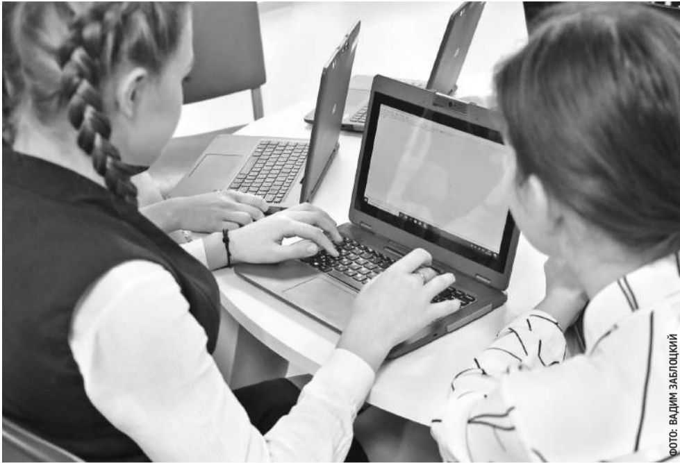
В Ровеньской школе № 2 на занятиях часто используют ноутбуки